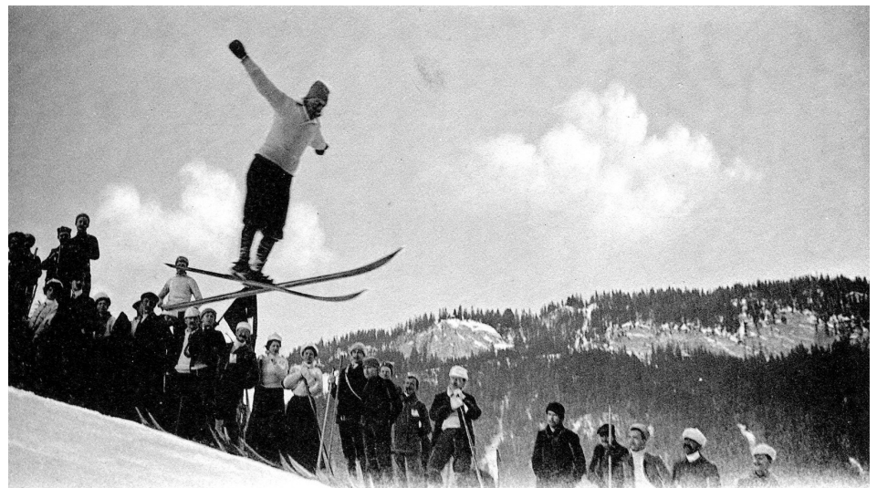
Ski-Sport - Le Saut