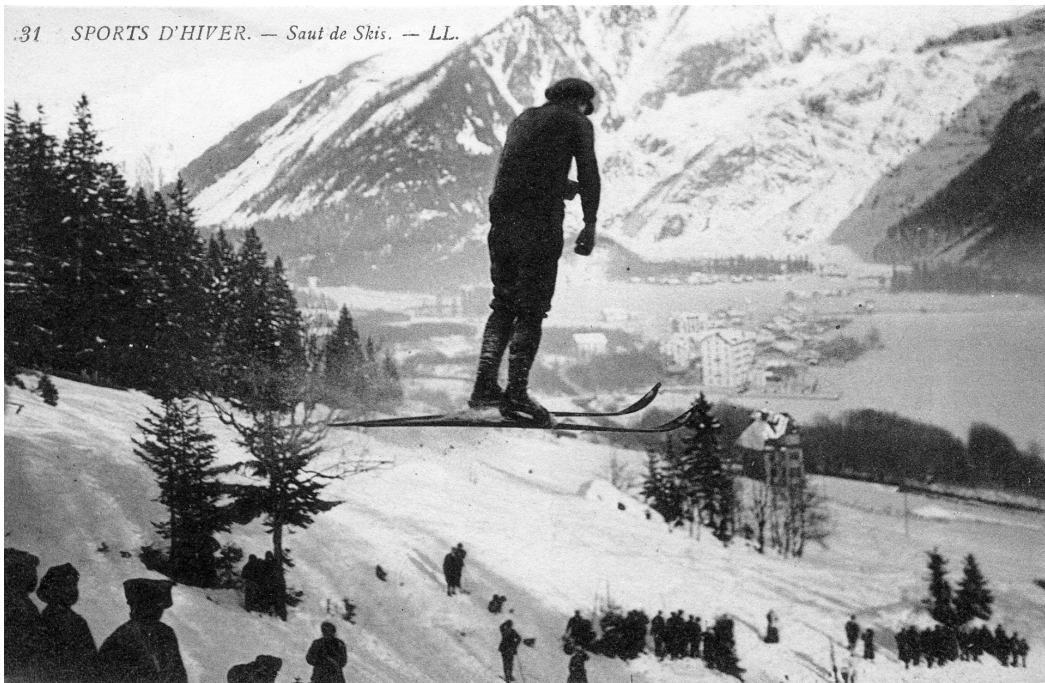
.31 SPORTS D'HIVER. — Saut de Skis.